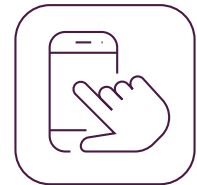
Aplicación de Control